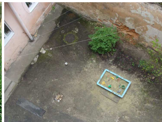
У 2014 р. відновлюються у м. Львові в рамках програми 3 двори. Фото стану одного двору до і після проведення робіт