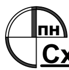
Схема розташування території у планувальній структурі генерального плану м. Львів М1:5000