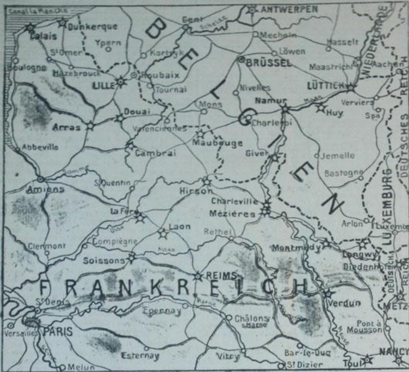
☆ Festungen — Eisenbahnen — Grenzen БЕЛЬГИЙСЬКИЙ ТЕРЕН ВІЙНИ.

що не розуміли ні скарг, ні закликів, ні закликань.