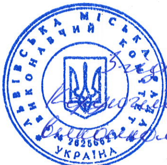
І. Васильків А. Садовий

Внести зміни до паспортів бюджетних програм на 2019 рік виконавчого комітету Львівської міської ради за кодами 0210160 «Керівництво і управління у сфері забезпечення діяльності виконавчих органів Львівської міської ради» та 0217670 «Внески до статутного капіталу суб'єктів господарювання», виклавши їх у новій редакції, що додаються.