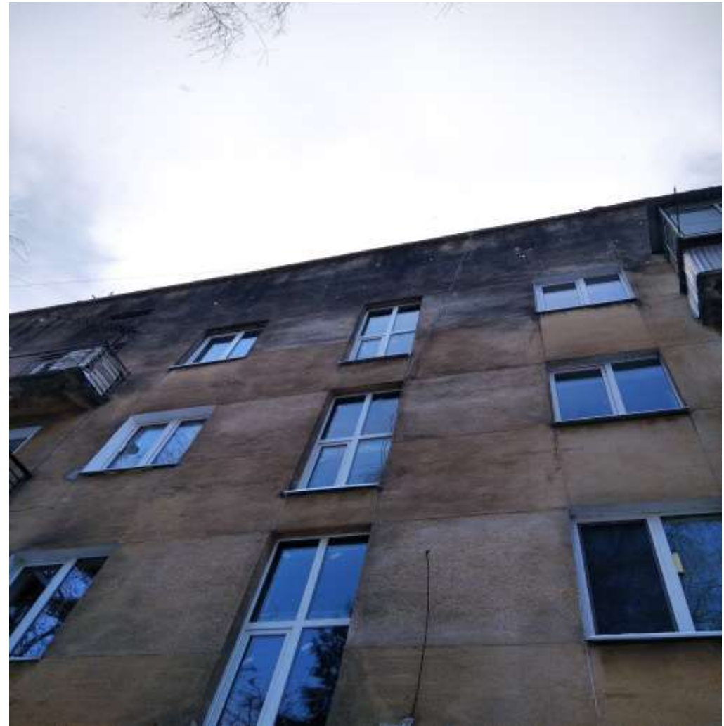
Городоцька,301 6 під.