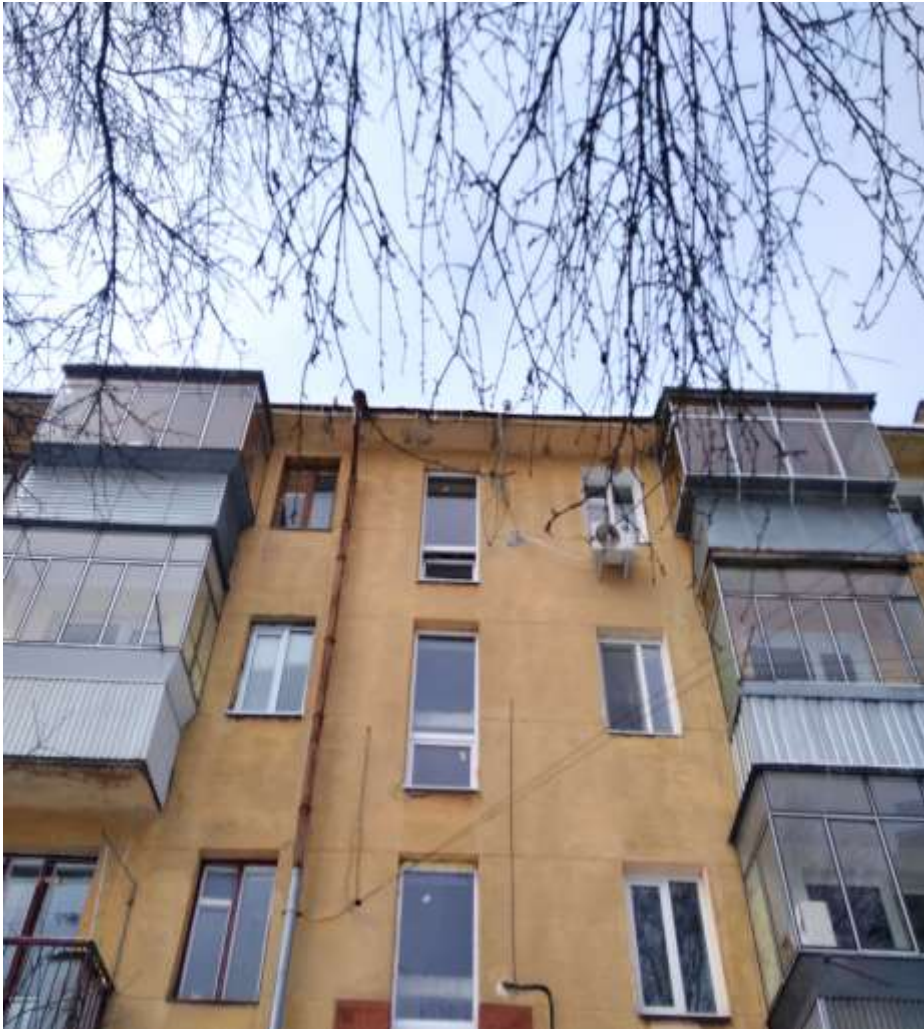
Городоцька,313 3 під.