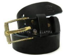
ШКІРЯНІ РЕМЕНІ З КЛАСИЧНОЮ ПРЯЖКОЮ