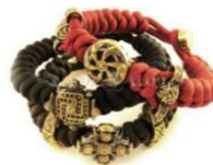
ПАРАКОРДОВІ БРАСЛЕТІ З НАМИСТИНАМИ