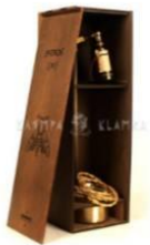
ЛАТУННІ НАСТІЛЬНІ ЛАМПИ "PATRON"