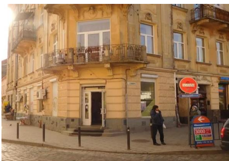
вул. Раппапорта Я., 1

(нежитлові приміщення у підвалі та на першому поверсі загальною площею 103,4 кв. м. за адресою: м. Львів, вул. Шевченка Т., 4).