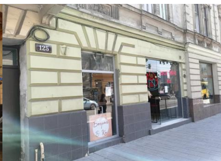
вул. Городоцька, 125