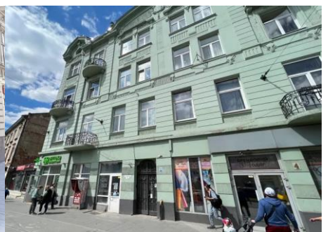
вул. Шевченка Т., 4