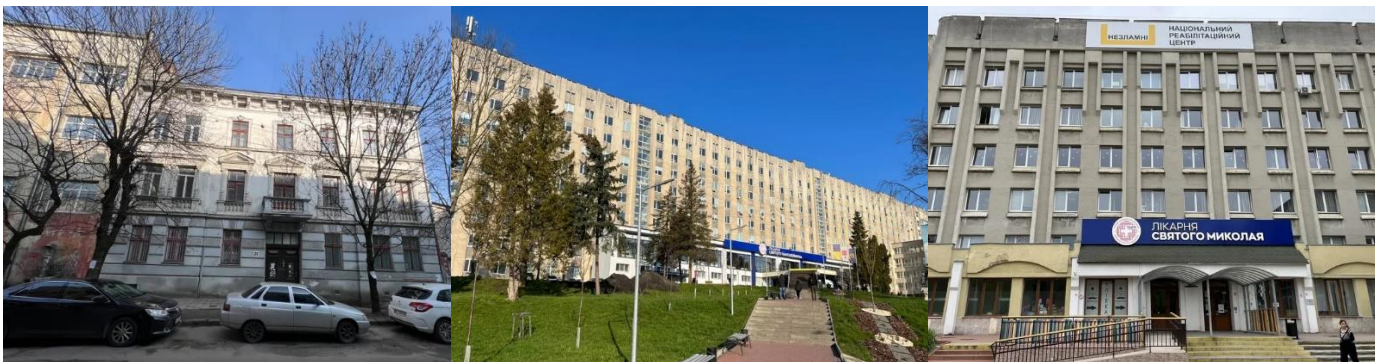
вул. С. Яблонської, 25

https://prozorro.sale/auction/LLE001-UA-20240816-08808