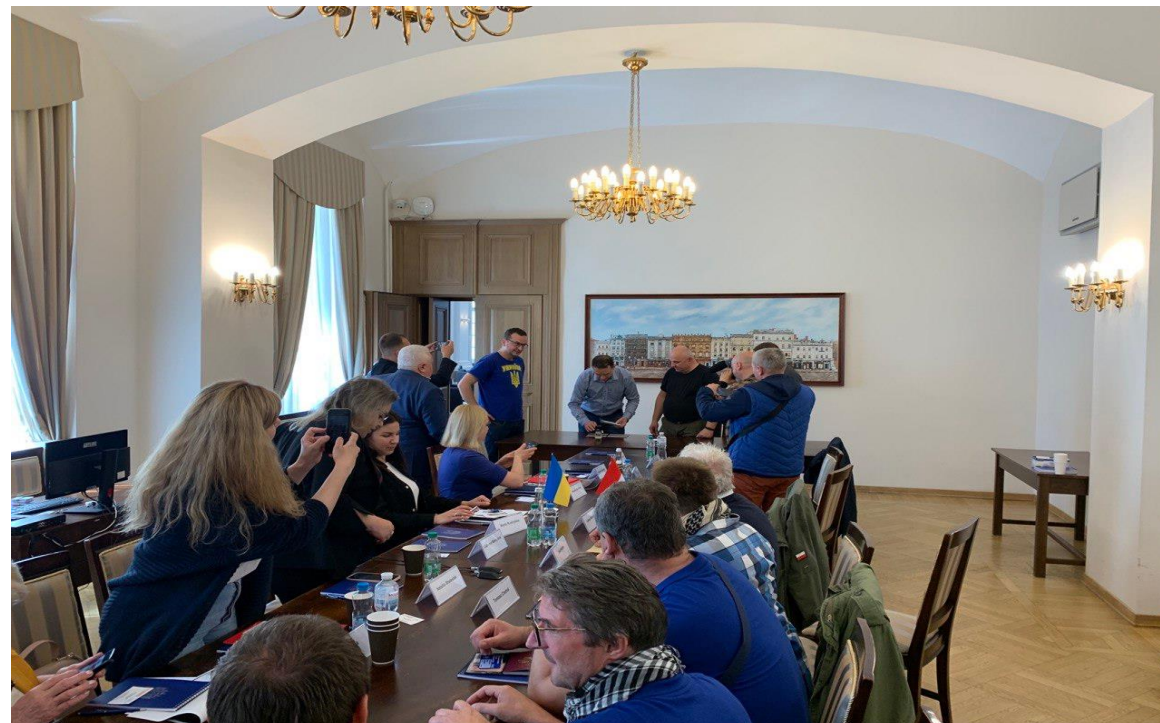
Прийом делегації депутатів Ради Міста Кракова у Львові в межах обговорення спільних проєктів та надання гуманітарної допомоги для внутрішньо переміщених осіб.