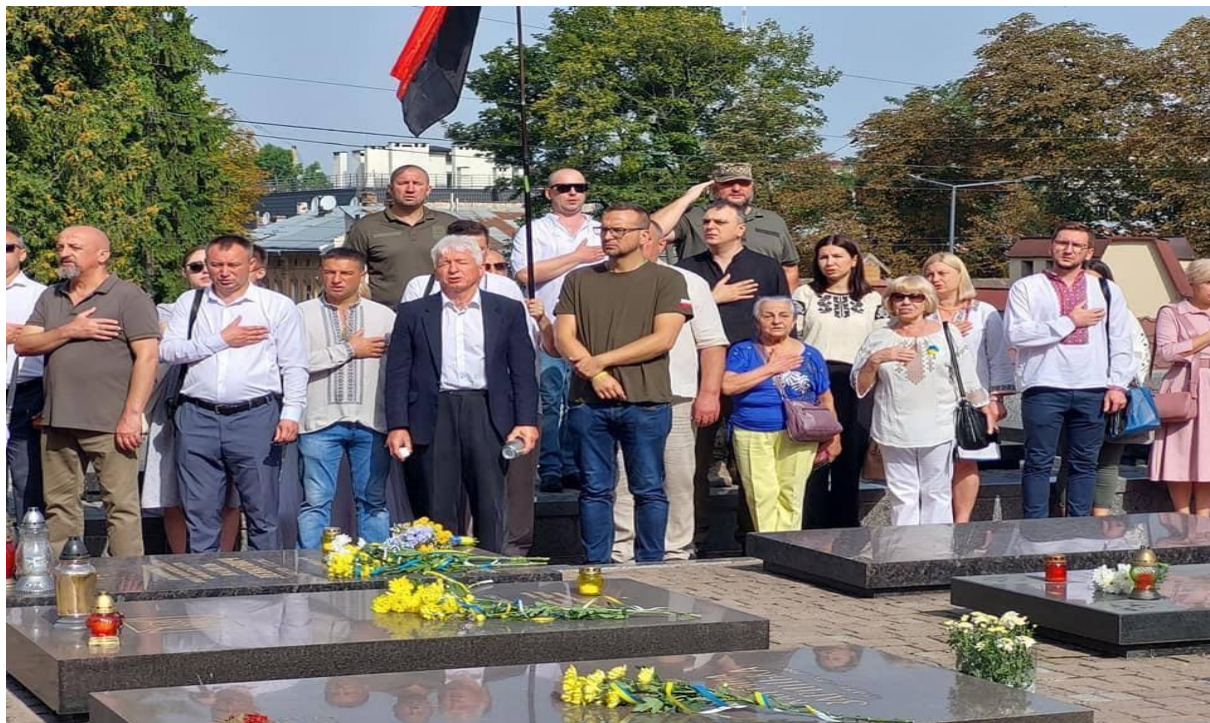
Прийом делегації депутатів Ради Міста Кракова у Львові з метою вшанування полеглих Героїв України в День Незалежності України.