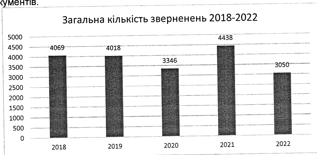
Рис 1. Динаміка надходження в управління звернень, заяв та документів у 2018-2022рр.

За звітній період на розгляд в управління надійшло 3050 звернень, заяв і документів.