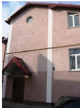
Нові бюджетні установи для містян