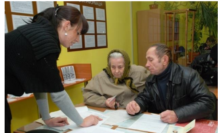
Муніципальні виплати потребуючим