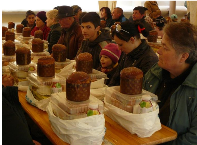
Подарунки до різноманітних свят та визначних дат