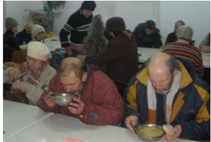
Обіди нужденним: Соціальні акції з подолання бідності