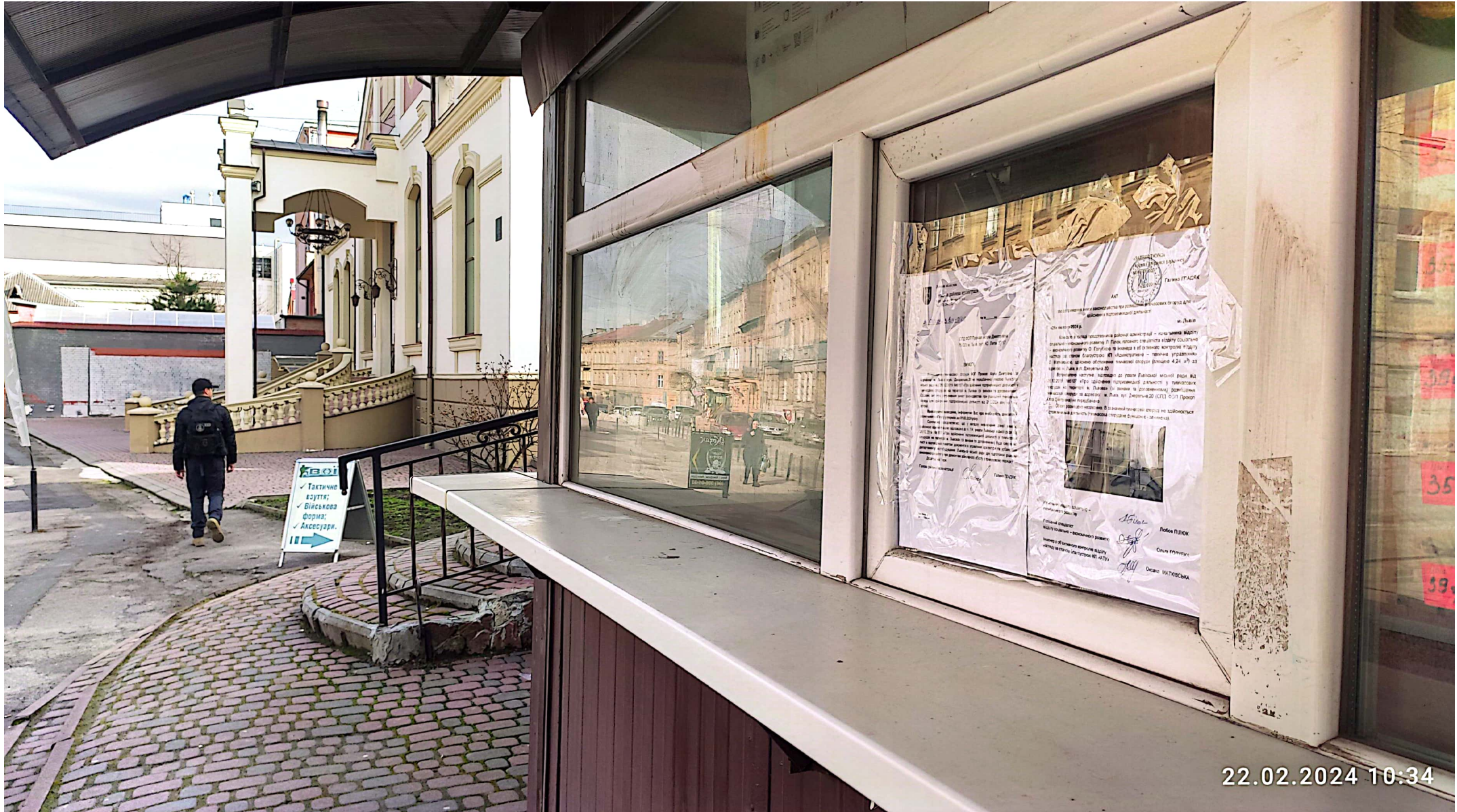
Відскановано за допомогою CamScanner