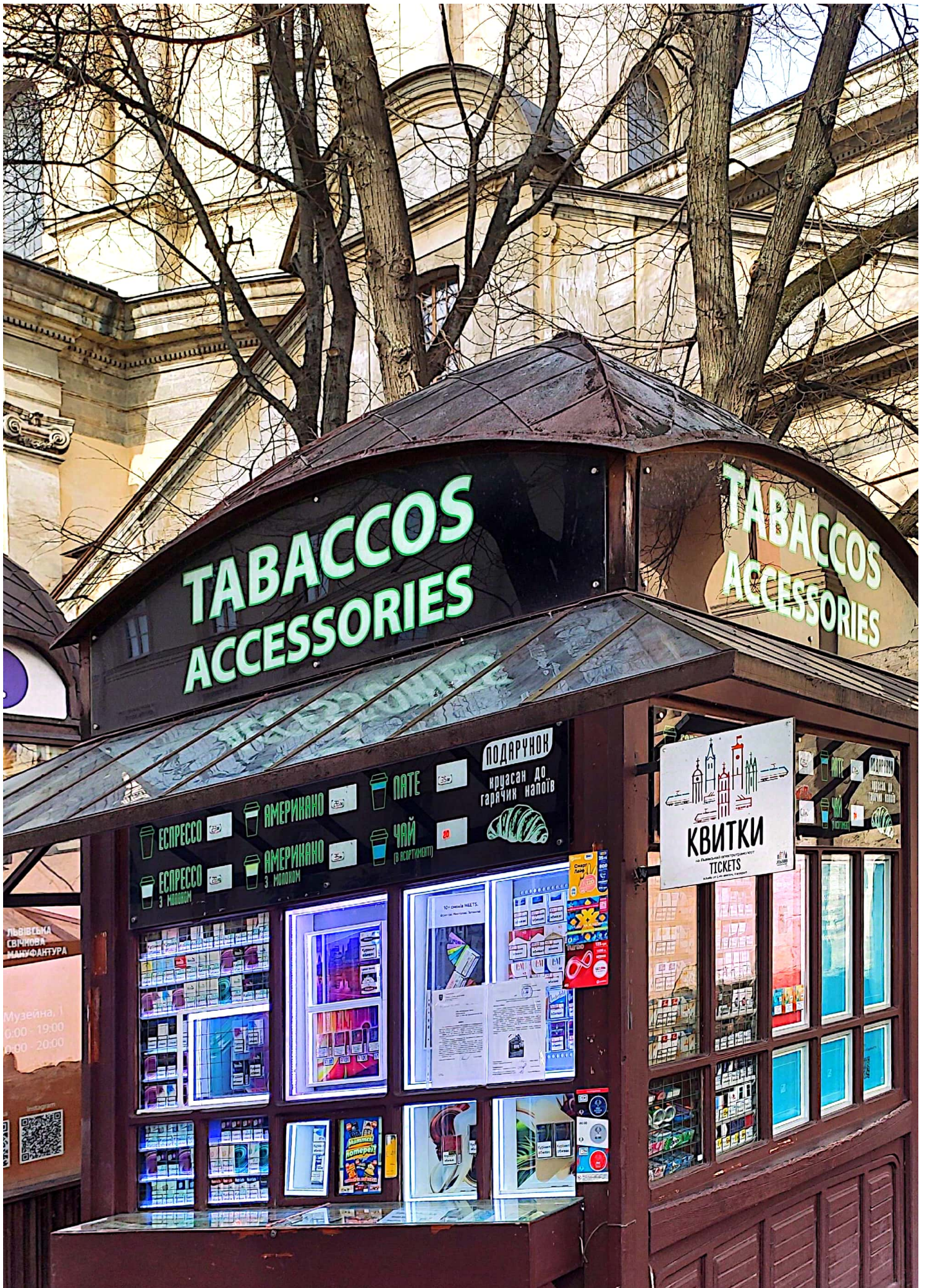
Відскановано за допомогою CamScanner